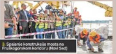
3. Spajanje konstrukcije mosta na Fruškogorskom koridoru (Novi Sad)