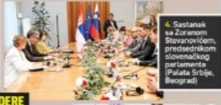
4. Sastanak sa Zoranom Stovanovićem, predsednikom slovenačkog parlamenta (Palata Srbije, Beograd)