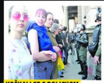
KOŠKALI SE S POLICIJOM