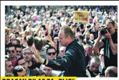
DRAGAN ĐILAS ZA „BLIC“