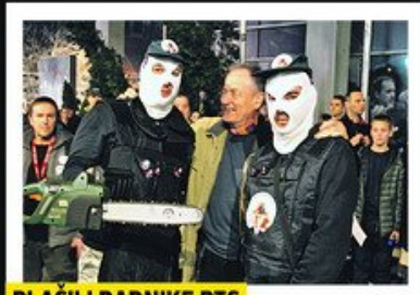
PLASILI RADNIKE RTS

I JUČE JE U VIŠE NAVRATA DOŠLO DO OKRŠAJA S POLICIJOM