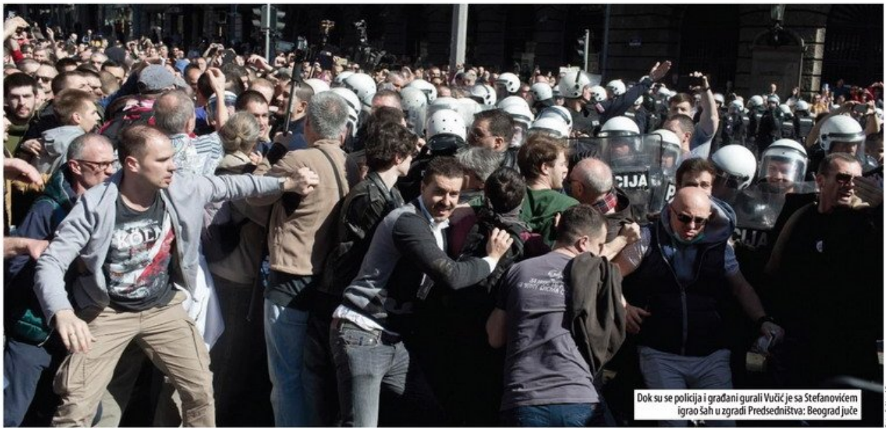
Dok su se policija i građani gurali Vučić je sa Stefanovićem igrao šah u zgradi Predsedništva: Beograd juče

Predsednik Srbije, čija se ostavka traži, držao pres-konferenciju dok su demonstranti bili pred vratima zgrade Predsedništva ■ Privedeno sedmero demonstranata zbog upada u RTS, što je bio razlog da se protesti premeste ispred zgrade MUP ■ NUNS i NDNV : Incident na RTS posledica opasnih tenzija u društvu za koje je najodgovornija vlast