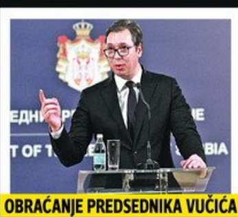
OBRAĆANJE PREDSEDNIKA VUČIĆA