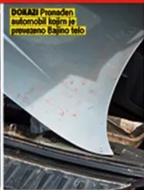
DOKAZI Pronađen automobil kojim je prevezeno Bajino telo