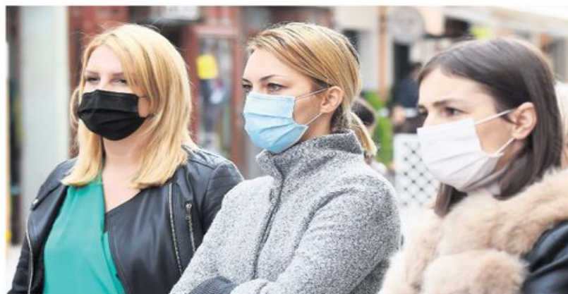
Новосађанке поштују савет епидемиолога да је заштита неопходна у пешачким зонама где има много људи