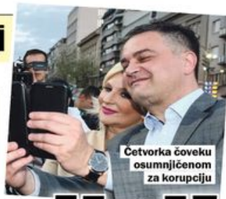
Cetvorka čoveku osumnjičenom za korupciju