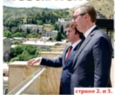
странице 2. и 3.