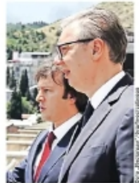
ВУЧИЋ РАЗГОВАРАО СА ИРАКЛИЈЕМ КОБАХИДЗЕОМ

У међувремену, шта је са постигнутим иранским нуклеарним програмом, а посебно са процесом „директног разговора“? страница 3