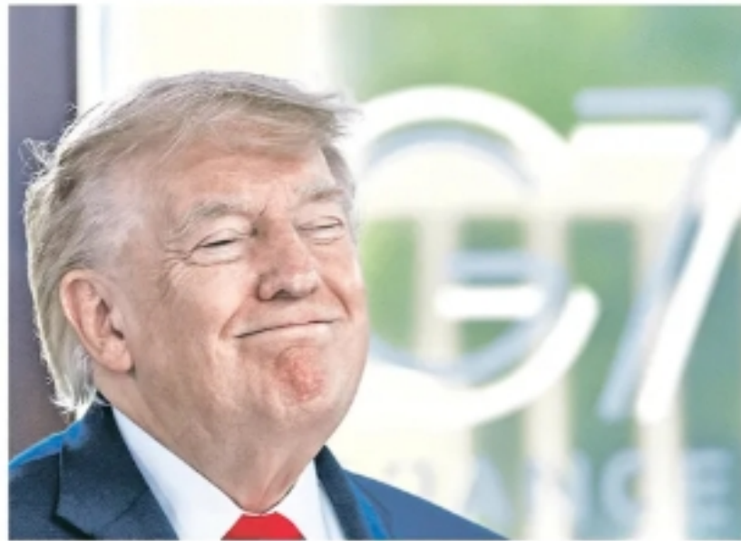
Доналд Трамп јуче на савету лидера Г7 у Бијану