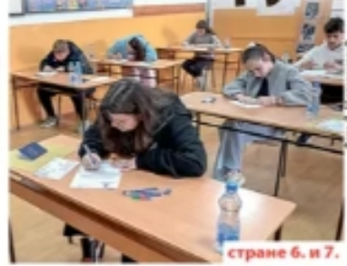
странице 6. и 7.