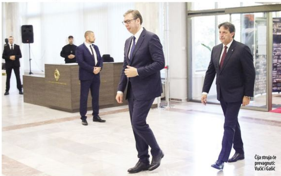
Čija struja će prevagnuti: Vučić i Gašić