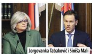
Jorgovanka Tabaković i Siniša Mali

TEMA: Zašto je ponovo produžen rok za formiranje nove Vlade Srbije do samog „foto-finiša“