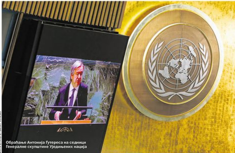
Обраћање Антонија Гутерреса на седници Генералне скупштине Уједињених нација

Иран спреман и за „максималан” одговор стр. 3