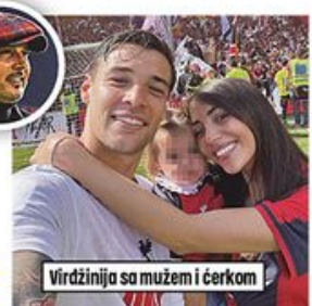
Virdžinija sa mužem i ćerkom