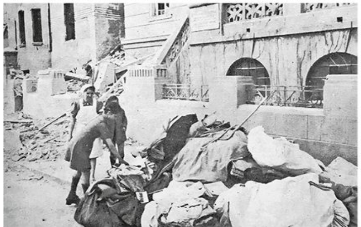
Разорено породилиште „Краљице Марије”, данашња Студентска поликлиника у Крунској улици

лозима, јер и да је цео Београд до последњег дома био срушен, поравњен са земљом, да је изгинуло све његово становништво, до последњег одојчета у колевци, опет свршетак рата не би био ни за тренут убрзан нити би његов исход за длаку био измењен”, стајало је у предговору књиге „Београдски крвави Ускрс”, која се појавила јула 1944. и у којој је било објављено 60 фотографија о савезничком бомбардовању Београда, које су приказане и на посебној изложби.