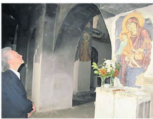
Петер Хандке пред фреском у Богородици Љевишкој

Петер Хандке зна да је фреска лепа. Пристао би да сви који га нападају гуте заједно с њим у спаљеној Богородици Љевишкој