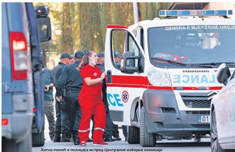
Хитна помоћ и полиција испред Централне изборне комисије