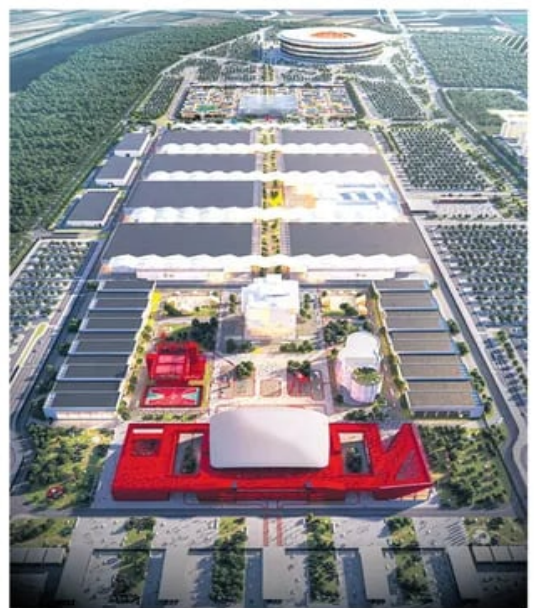
Будући изглед комплекса Експо 2027

Експо ће ући у историју као један од најзначајнијих европских грађевинских пројеката, захваљујући повољној инфраструктурној позицији и повезаности са главним саобраћајницама, рекао је Мали. страница 11