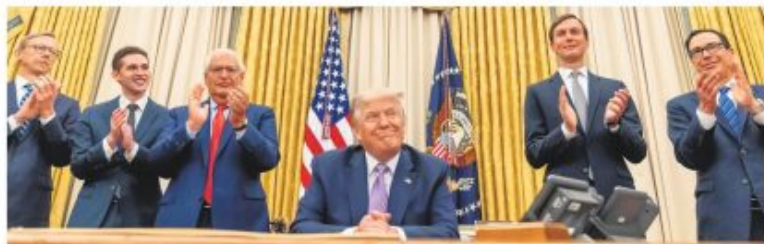
Задовољство у Белој кући након постицања договора