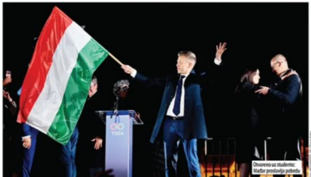
Otvoreno uz studente: Mađar proslavlja pobjedu