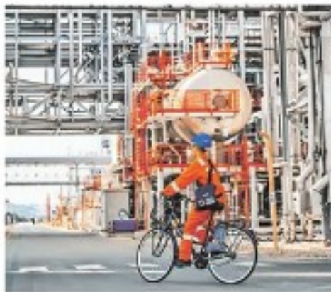
Плово преко „Нафто индустрије Србије“