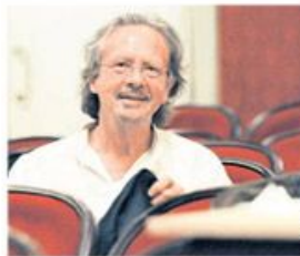
Аустријски писац Петер Хандке