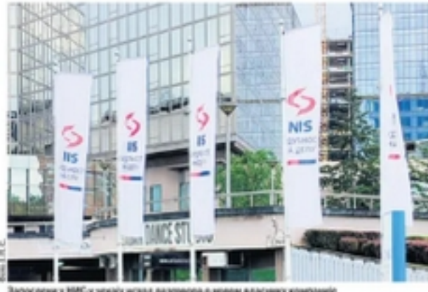
Запослени у НИС у чекају испод развојера о новом власнику компаније