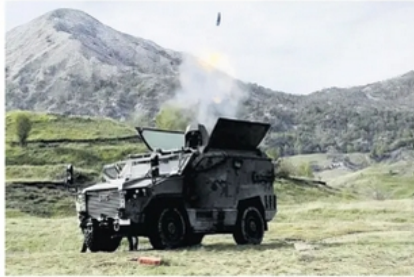
„Бурак“, високоманеварно оклопно возило турске производње са многобачним калибра 120 мм, на вежбањима у Албанији