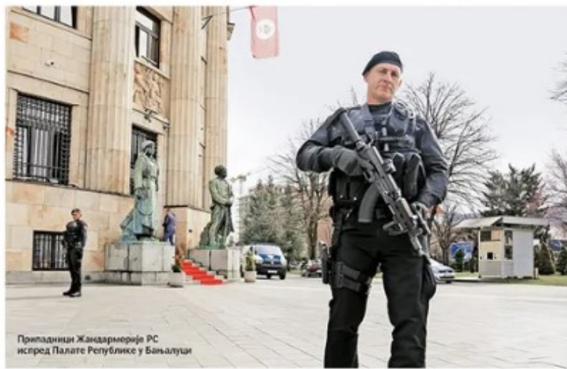
Припадници Жандармерије РС испред Палате Републике у Бањалуци

У Сарајеву воде истрагу против руководства РС због напада на уставни поредак, у Српској тврде да нико неће бити ухапшен