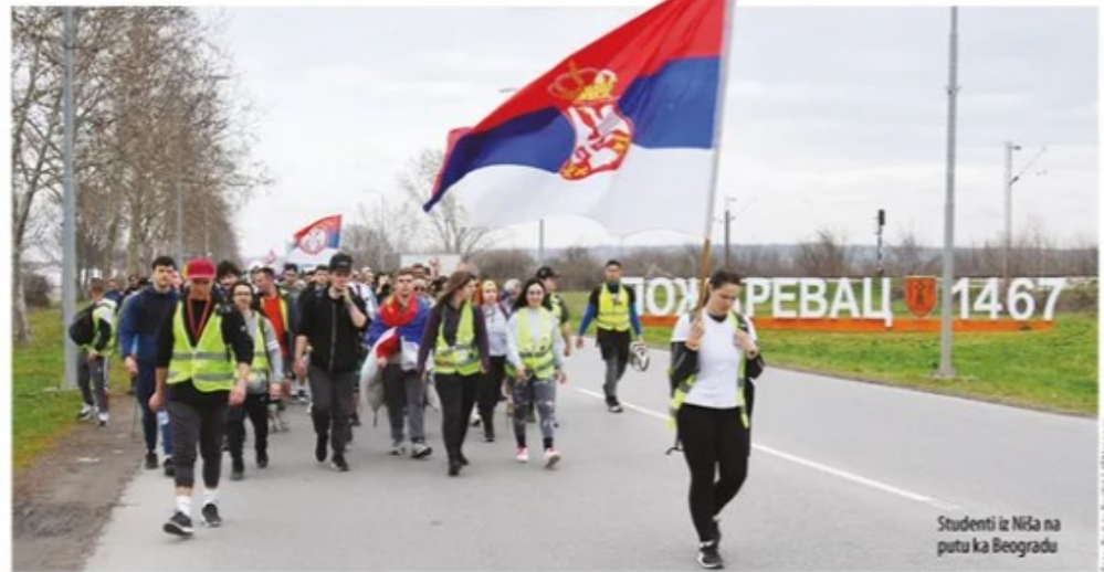
Studenti iz Niša na putu ka Beogradu