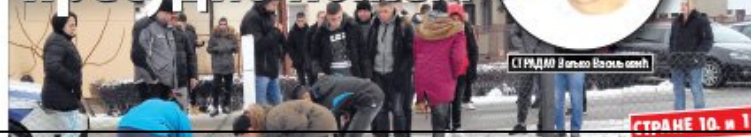
Фото: С. Мокрић