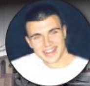
СТРАНА 10. и 11.