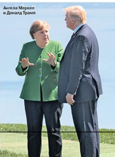
Ангела Меркел и Доналд Трамп

Након гласања у среду, републикански сенатор Тед Круз – иницијатор санкционисања агента „Северног тока 2“ – поновио је да ће закон, који ће усвојити Конгрес и потписати председник Доналд Трамп, омогућити енергетску безбедност Европе и спречити Русију да дође до милијарди долара које би могла да употреби за агресију. Одлука Представничког дома налаже Стејт департменту да у року од 60 дана преизменира које компаније – градитеље „Северног тока 2“ и њихове руководиоце треба подвргнути казним мерама и санкцијама. У међувремену, и амерички Сенат треба у веома кратком року, до 20. децембра, да гласа о истом предлогу закона. Уколико оба тела америчког Конгреса у пуном саставу изгласају дотични предлог у закон, документ путује у Белу кућу, где председник Трамп може да га потпише или стави вето.