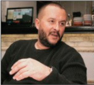
Autor i voditelj „Skromne večeri sa Ivanom Ivanovićem“ za Danas