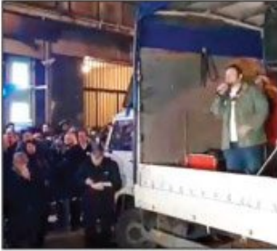
Ocene na protestu jednog od govornika o Pravnom fakultetu u Beogradu izazvale brojne reakcije