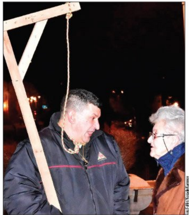
Maketa vešala viđena, sem Beograda, u Nišu i Kragujevcu: Detalj sa protesta u Nišu

Birokratski simptom „fali ti još jedan papir“ doteran do apsurdna u slučaju Industrije kablova