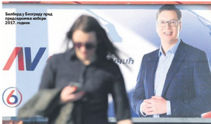
Билборд у Београду пред председничке изборе 2017. године