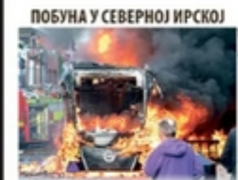
ПОБУНА У СЕВЕРНОЈ ИРСКОЈ