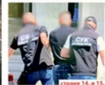
странице 14. и 15.

"ПАО" ВРХ ИНТЕРВЕНТНЕ Заташкали да је Боске пуцао на Ниловића