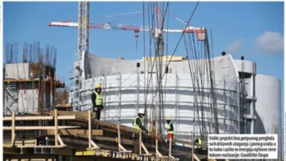
Veliki projekti bez potpunog pregleda svih državnih ulaganja i jasnog uvida u to kako i zašto se menjaju njihove cene tokom realizacije: Gradilne Ekipe