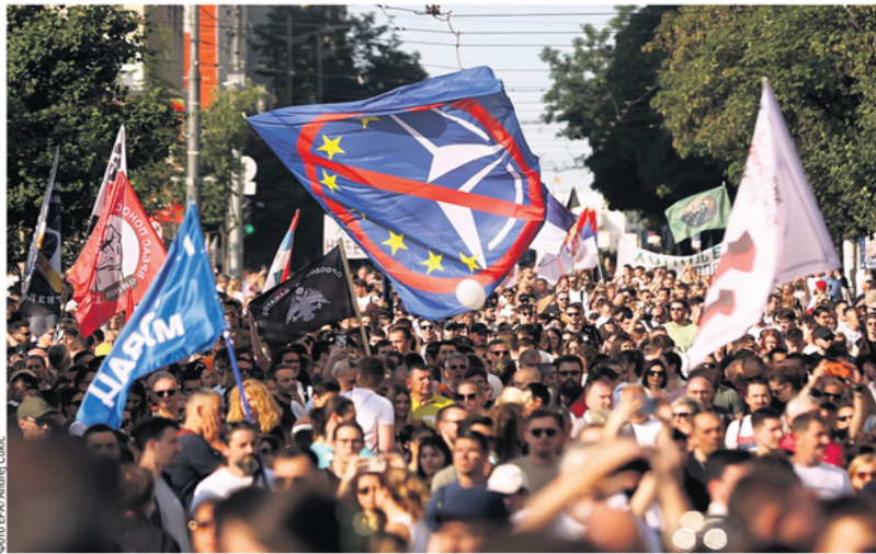
Блокадери левичари разочарани „десним скретањима“

Почела са радом платформа за пријаве „Ко си, бре, ти?“ стр. 5