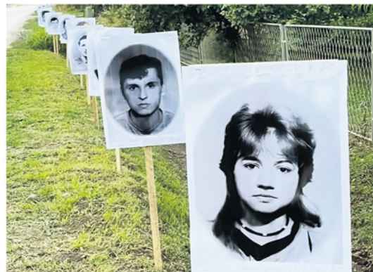
Фотографије убијених Срба поред пута Братунац–Поточари–Сребреница