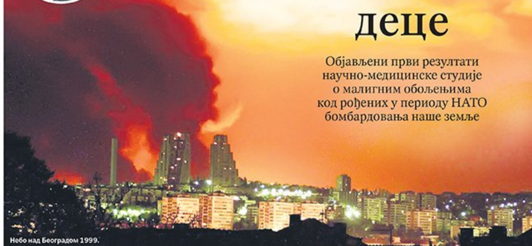
Небо над Београдом 1999.