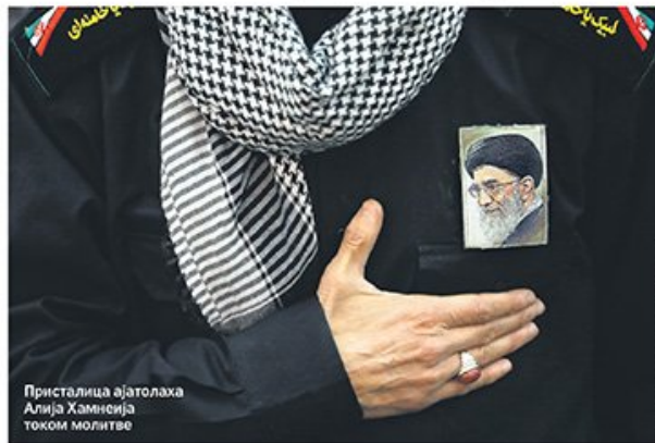
Пристица ајатолаха Алија Хаменија током молитве

Пре четири деценије присутствовао сам рушењу секуларне прозападне монархије и стварању Исламске Републике Иран, једног од најдраматичнијих догађаја 20. века, потресу који је променио ход живота и глобалну политику увео ислам, а борбу против хегемоније великих и малих „сатана“