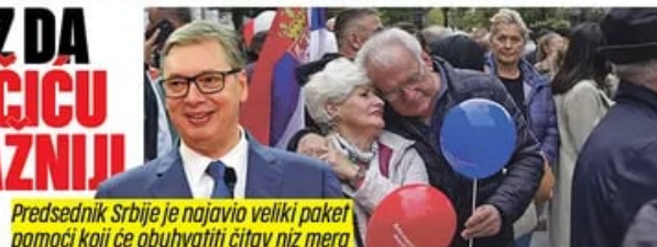
Predsednik Srbije je najavio veliki paket pomoći koji će obuhvatiti celi niz mera