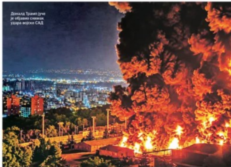
Доналд Трамп јуче је објавио снимак удара војске САД