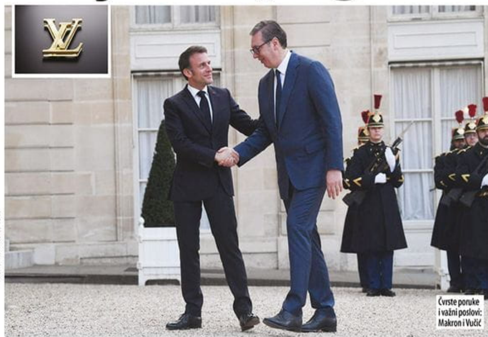
Čvrste poruke i važni poslovi: Makron i Vučić