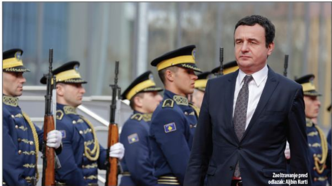
Zaoštravanje pred odlazak: Aljbin Kurti