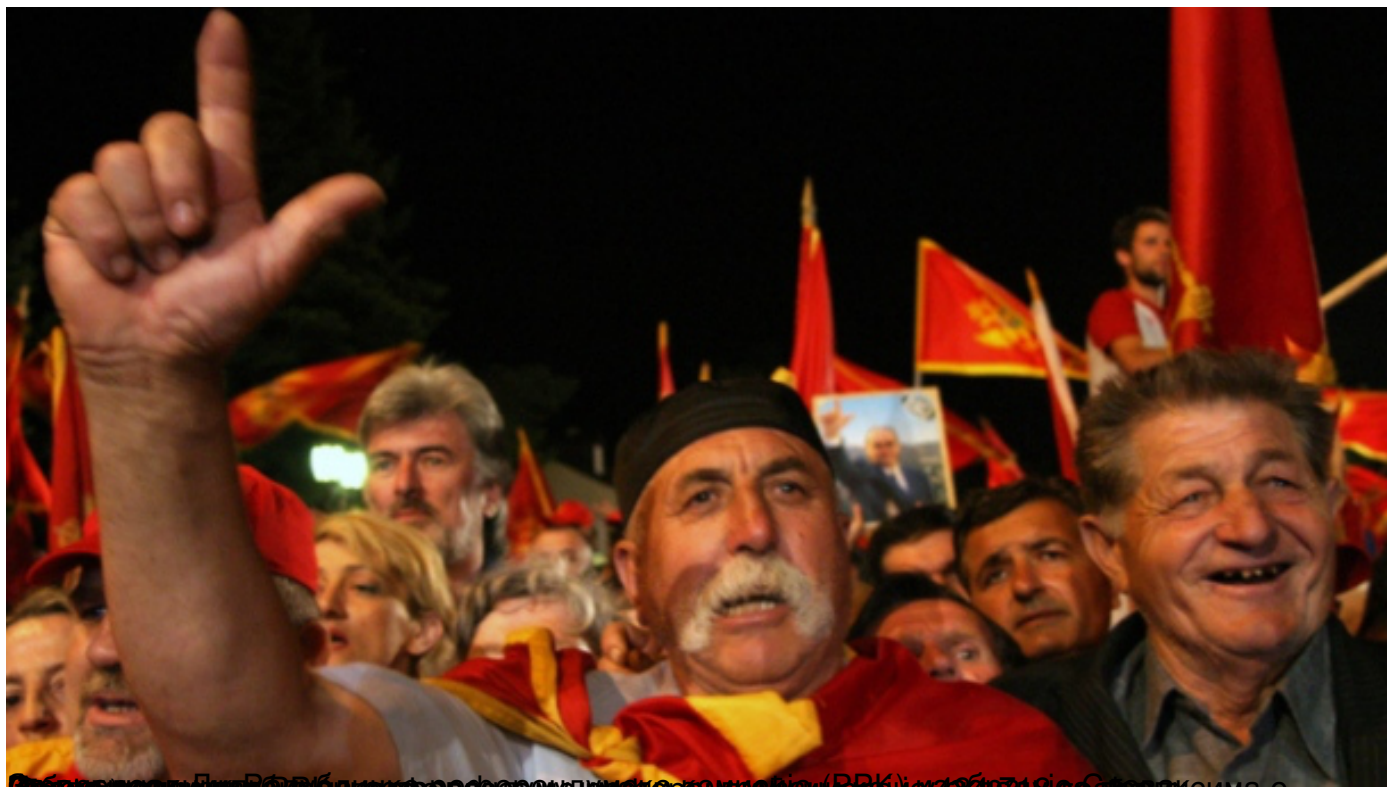
На данашњи дан 2006. одржан референдум у Црној Гори, на коме је тесном већином (55,5 % - 230.66 уторак, 21 мај 2019 08:57