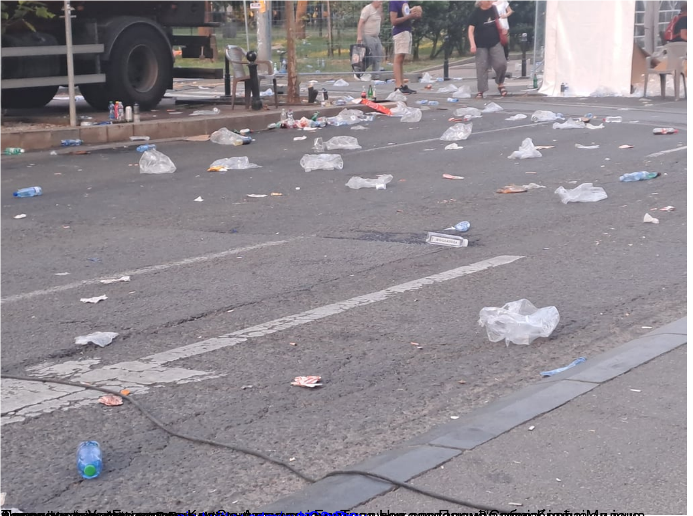
Датум: 27. јун 2026. 22:38 Локација: Београд Упутство: Гледајте како се смеће оставља на улицама, након завршетка скупа СН