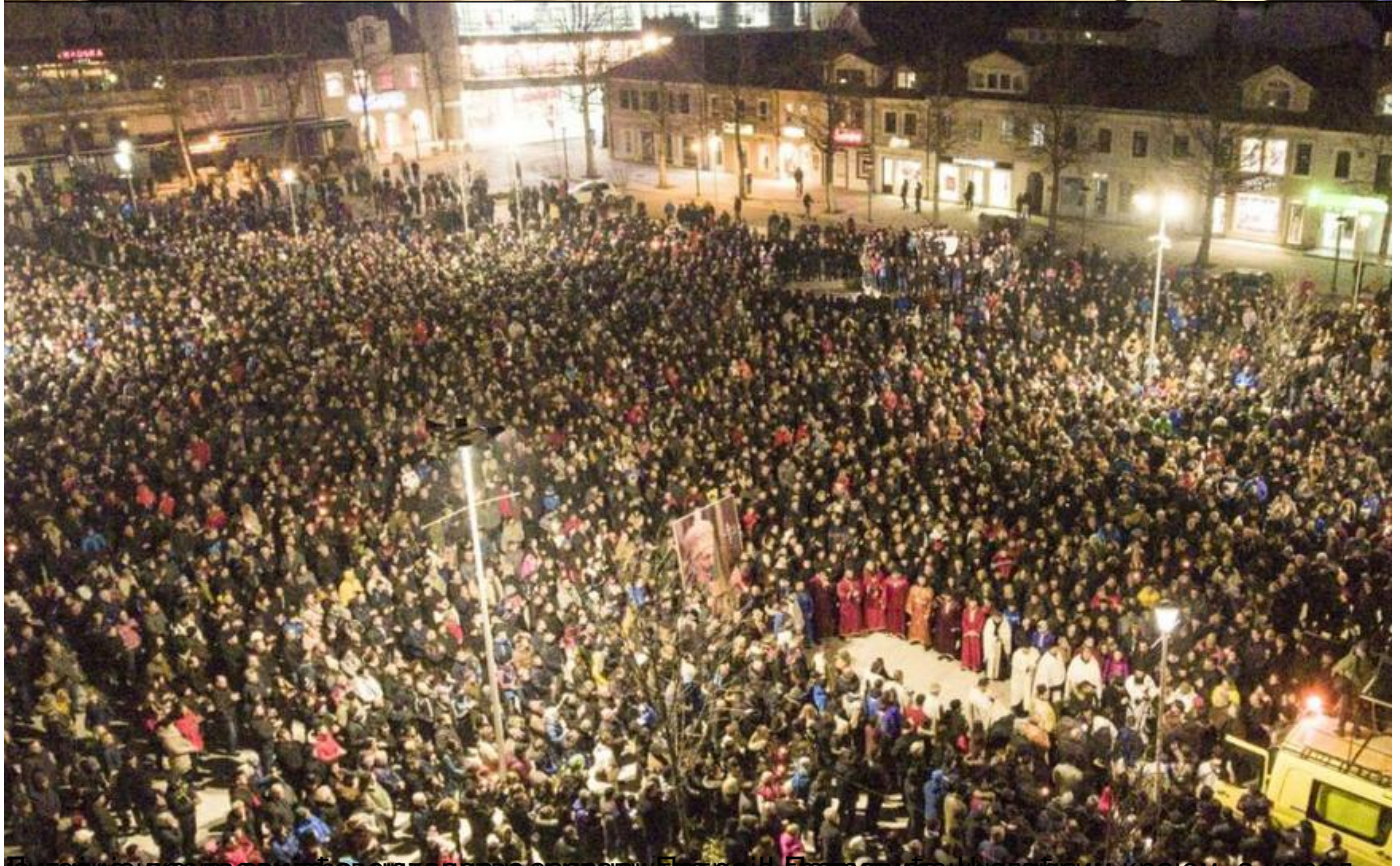
Једно од репрезентативних ешкена својом авулује ваје Граровираношешким крајем, а народ