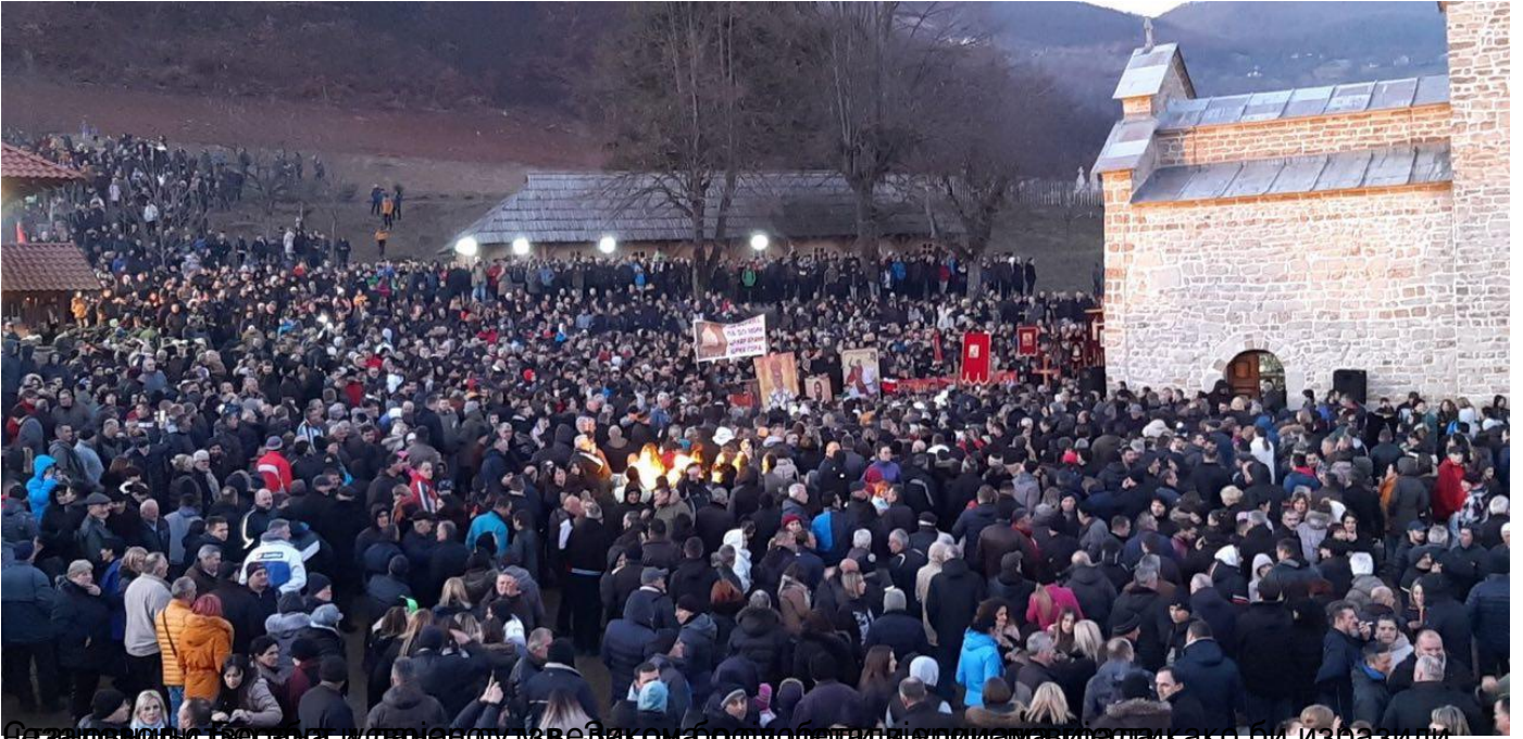
Без задршке Српска православања је у веома брзој промени у јериху како би изразили