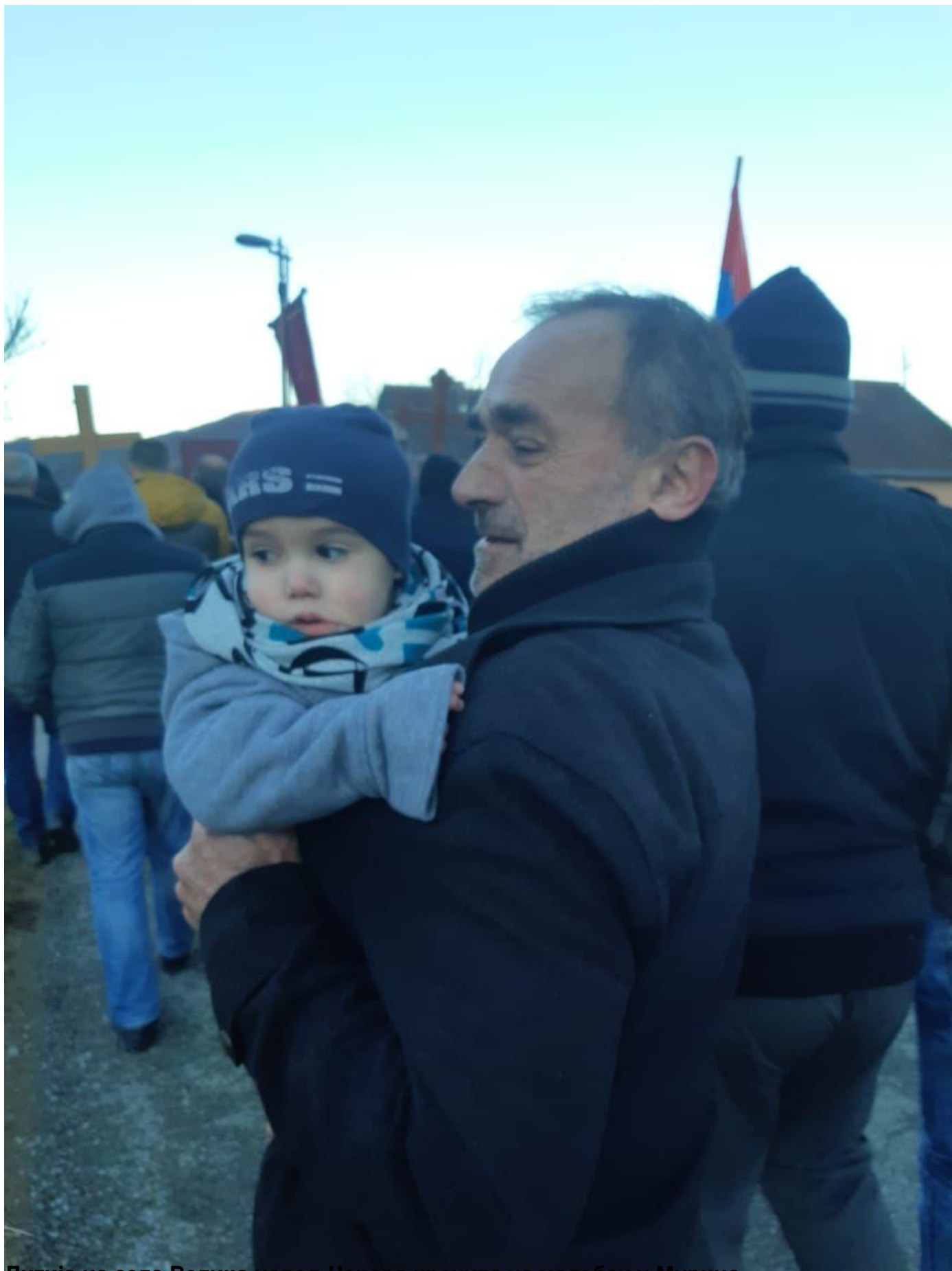
Литија из села Велика испод Чакора кренула на молебан у Мурино