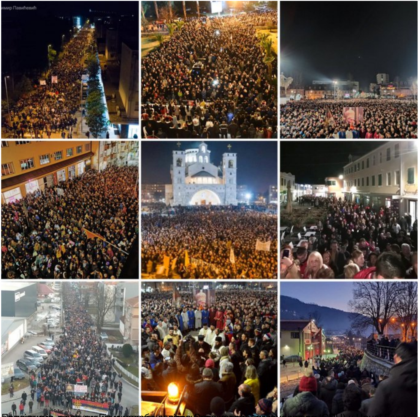
Будуће неће, да се који Епископ из Бановице одлаже православној држави (СПЦ) у Црној Гори,