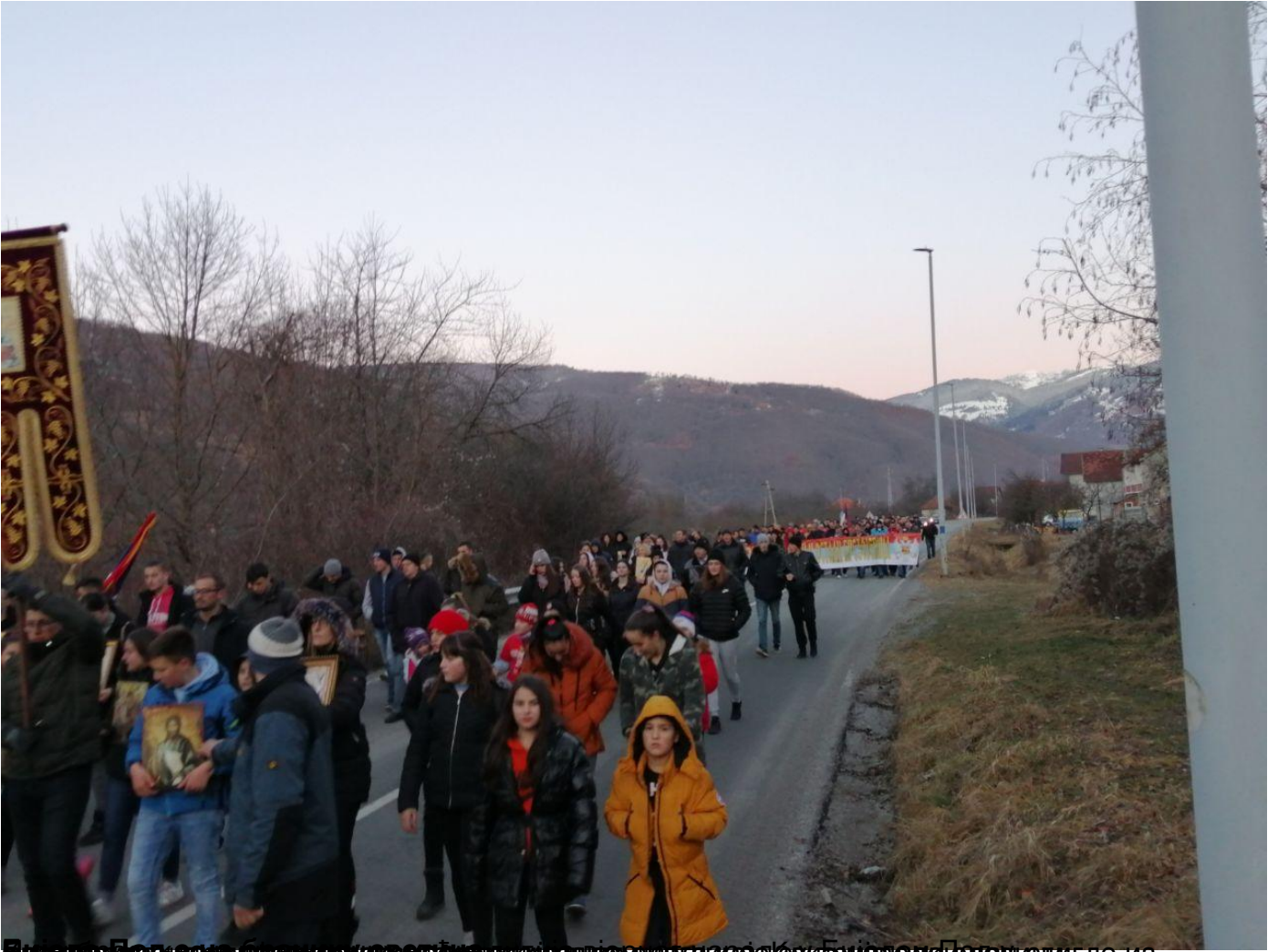
Број учесника у литији испред Храма Христовог васкрсена у Подгорици је износио око 50.000 људи.