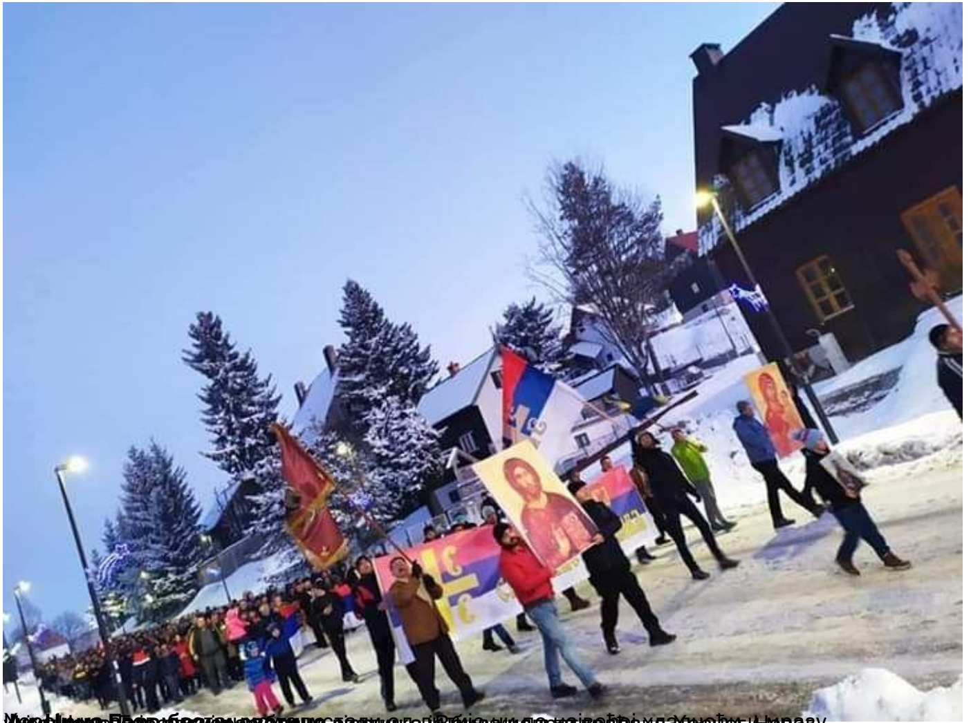
Улица Црне Горе брајнолике рана свадница. Више хиљада верника дође и у Нову.