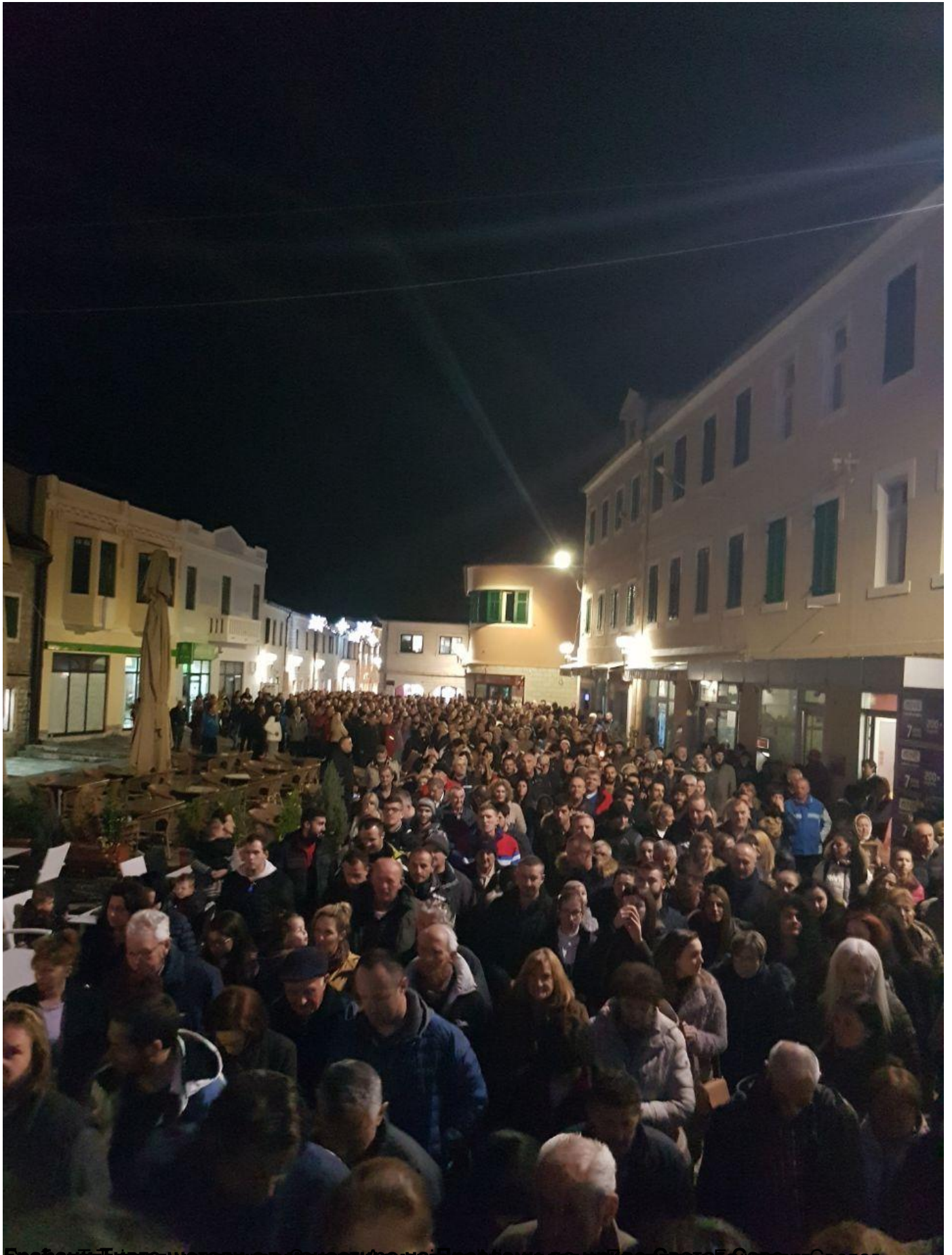
Грађани Подгорице окупили су се испред Храма Христовог васкрсена у Подгорици, четвртак, 30 јануар 2020 23:10