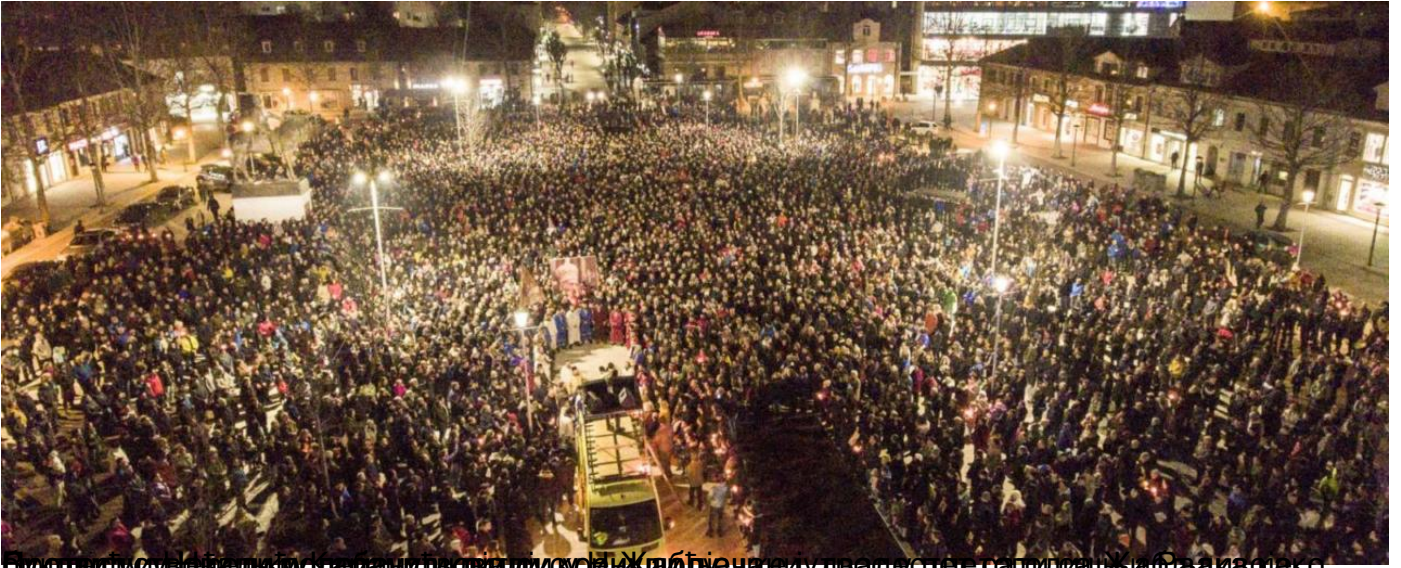
Око 50.000 грађана испред Храма Христовог васкрсена у Подгорици