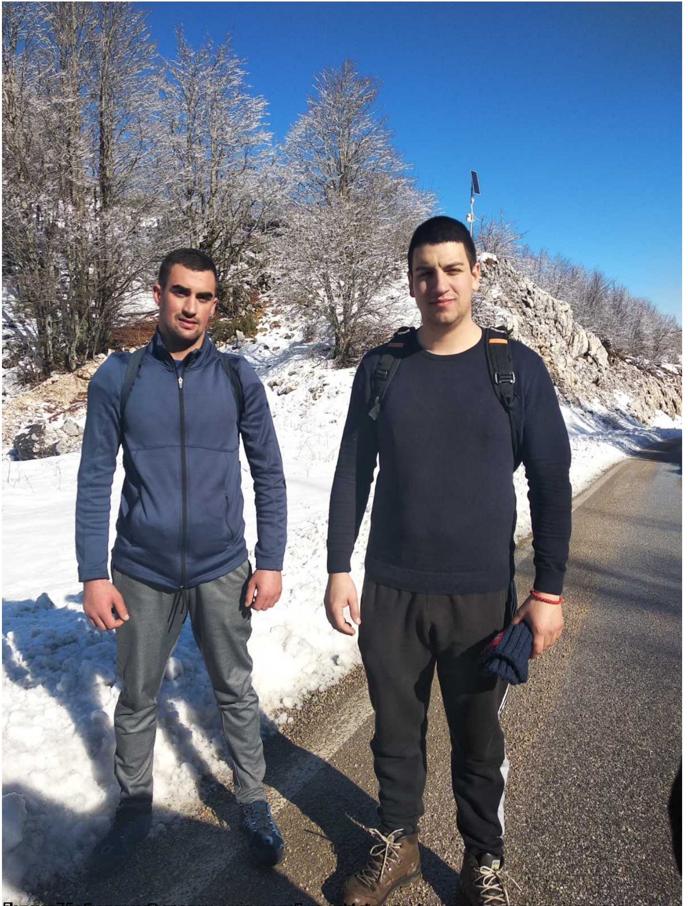
Бројне групе молебанских литијаша из различитих дијелова Црне Горе и околине Подгорице су се одлучили јер, како