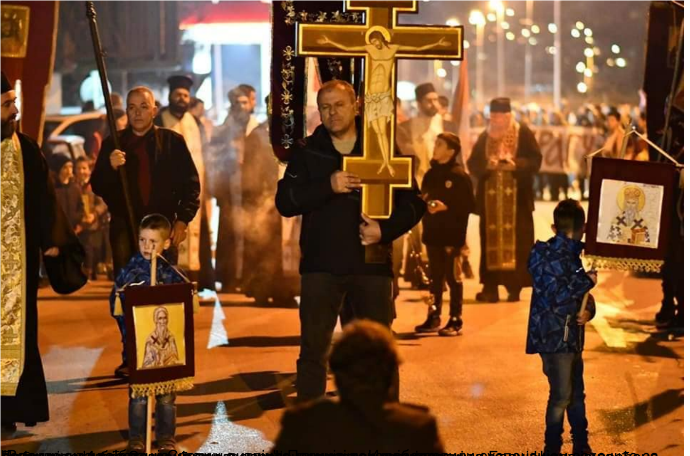
Датум: 30. јануар 2020. 23:10. Место: Црква Христовог васкрсена у Подгорици. Опис: Молебани и литије широм Црне Горе. Фотографија: [Немаје података]