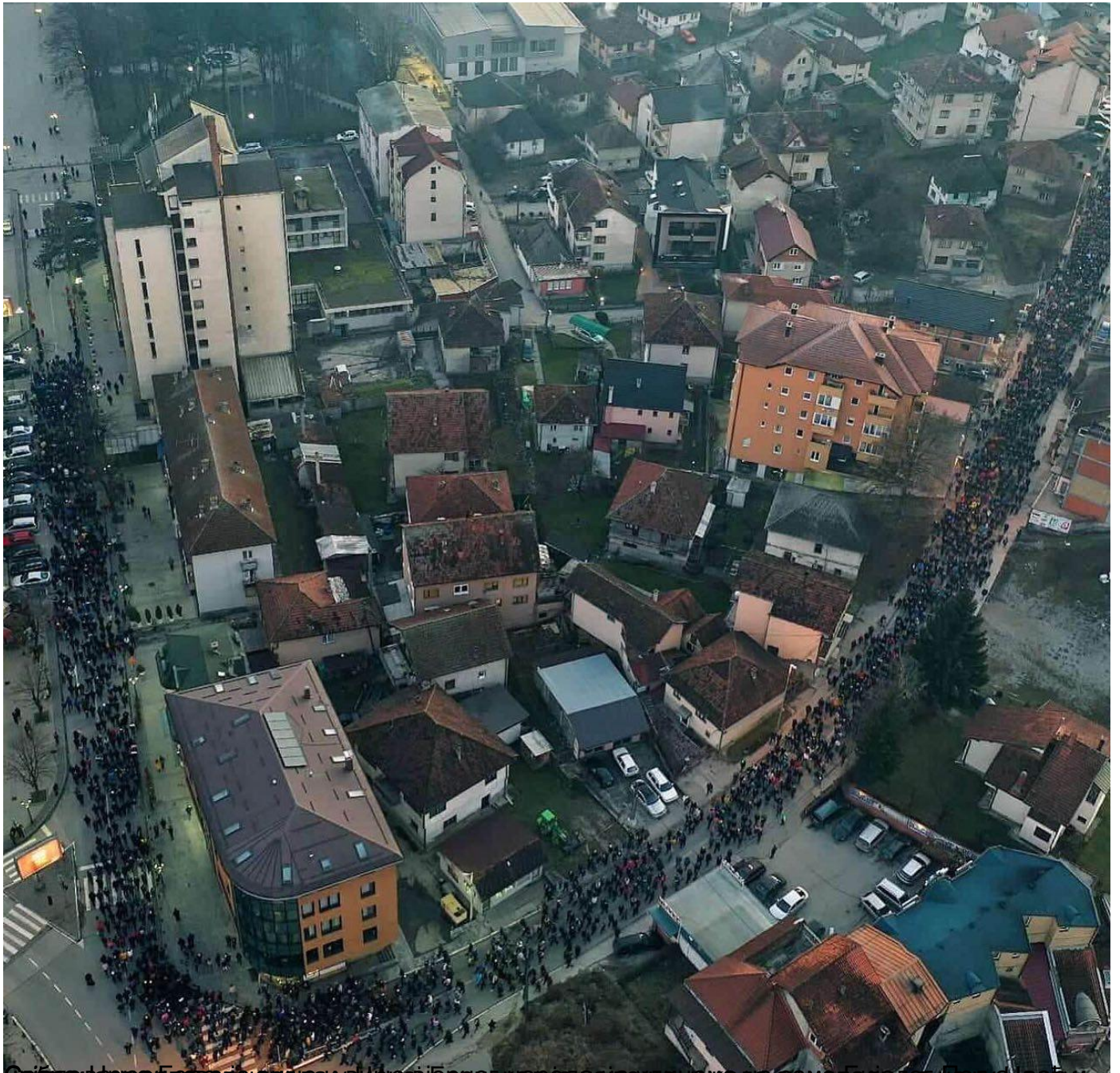
Видео снимак са дрона који приказује велику гоману људи испред Храма Христовог васкрсена у Подгорици, четвртак, 30 јануар 2020 23:10