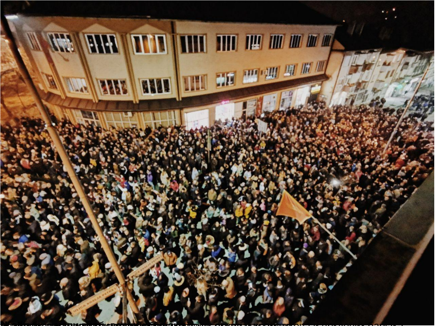
Око 50.000 грађана испред Храма Христовог васкрсена у Подгорици, четвртак, 30 јануар 2020 23:10. На слици се види велики број људи, црквене грађовине и црквених барјака,