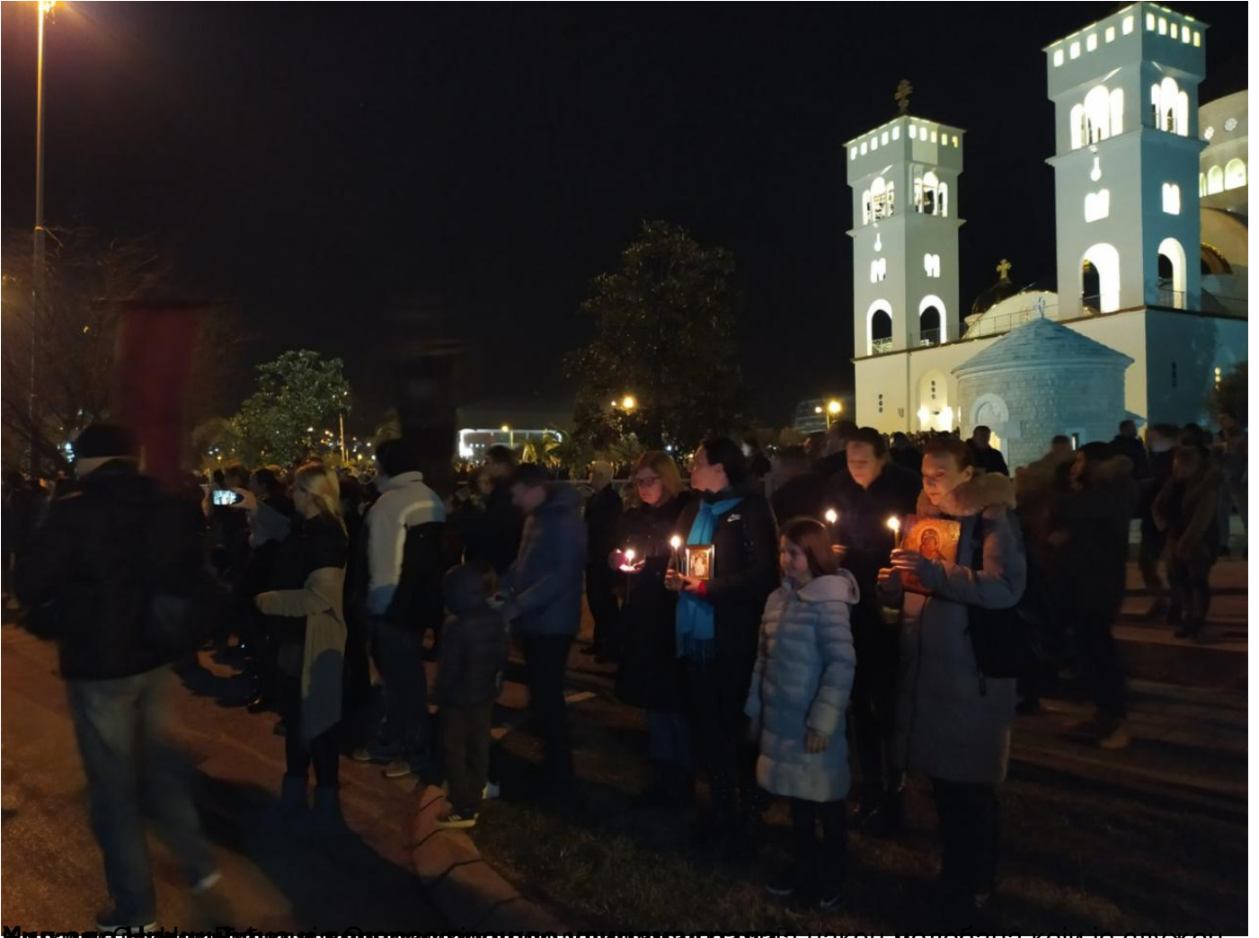
Народна литија испред Храма Христовог васкрсена у Подгорици након молебана који је служен