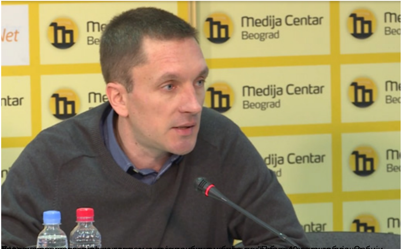
Ђулибрк: Апсолутно сиромаштво готово искоренено у Србији? Као да смо сви малоумни; Ив