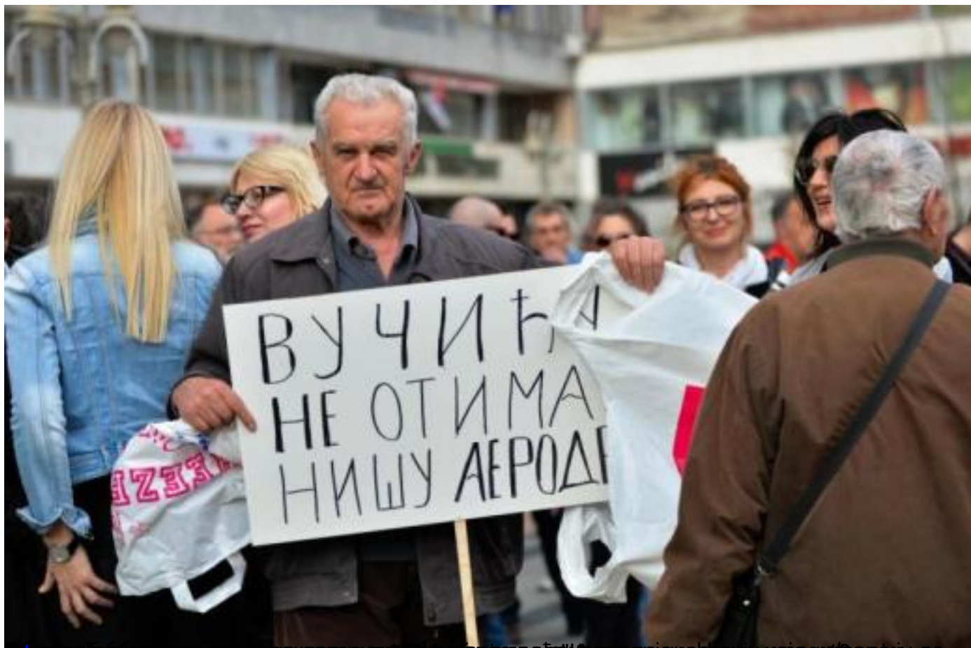
Јужне вести: Запосленима у Градској управи и јавним предузећима у Нишу наређено да иду на отворење