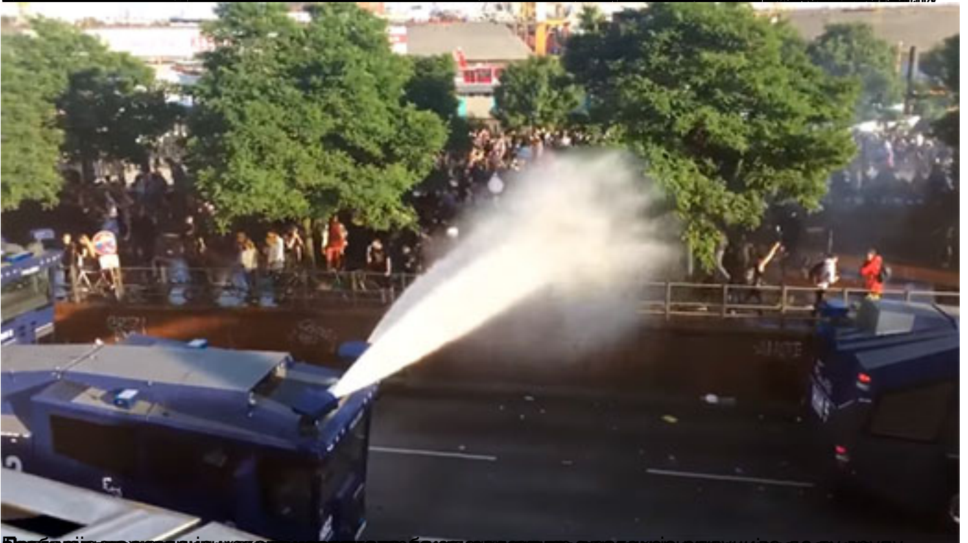
Београд, 07. јула 2017. Полиција је користила снажне млазнице воде да би се супроставила демонстрантима који су се окупили на улицама града у знак протеста против Самита Г-20.