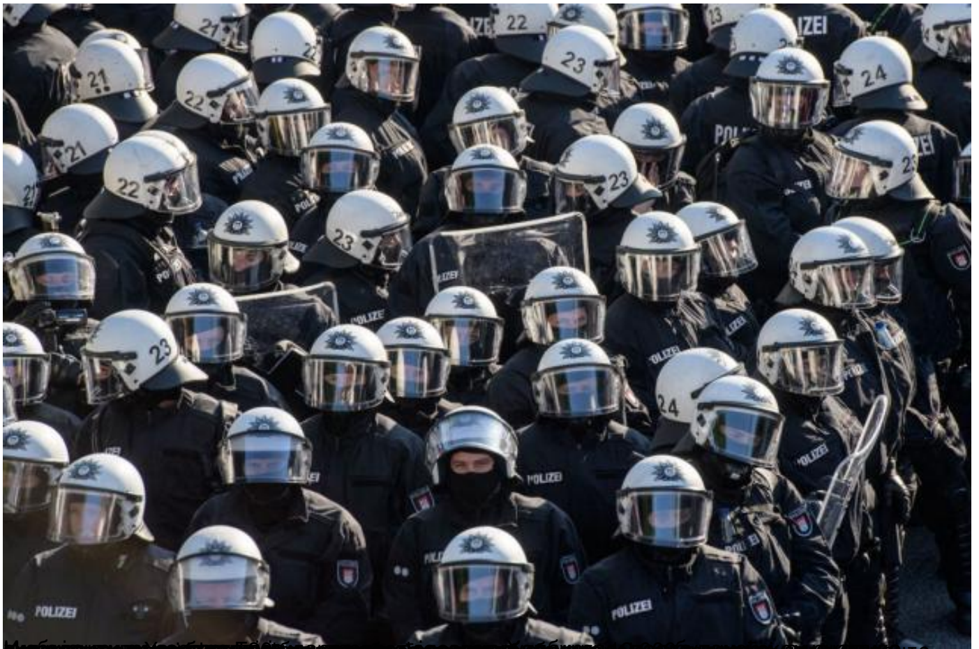
Италијански медиумски центар, Берлин