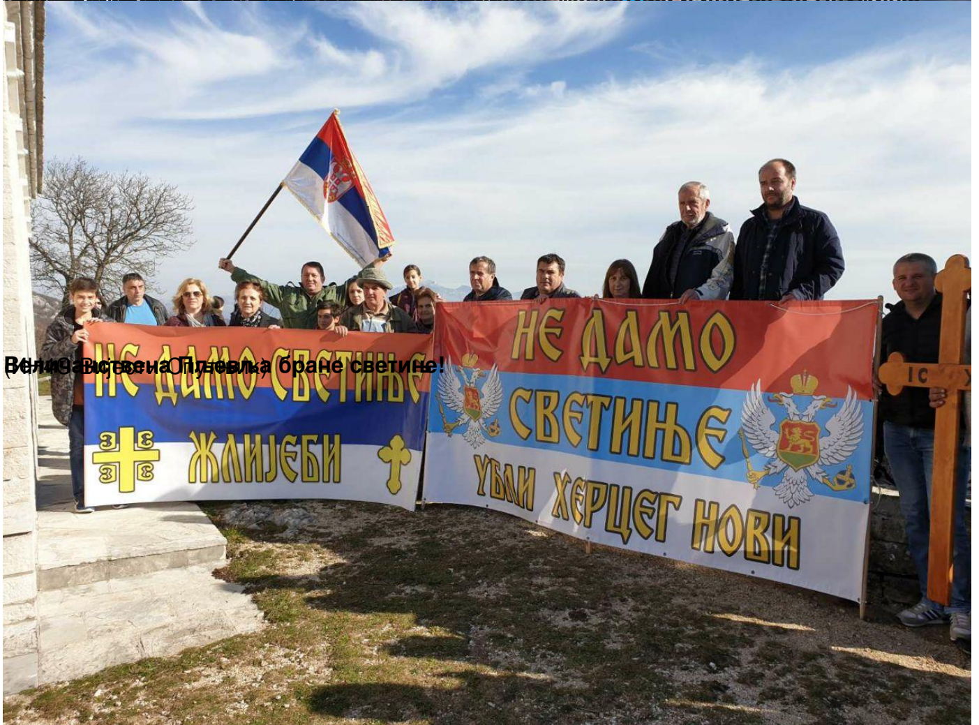
Велика Владика Плујина бране светиње!