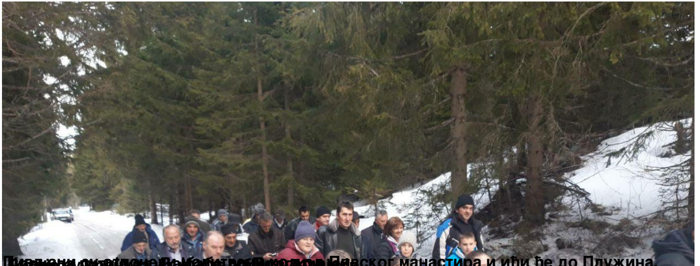
Пивљани окупационог Манастира Светог Давида у Пивском манастиру и ићи ће до Плујина