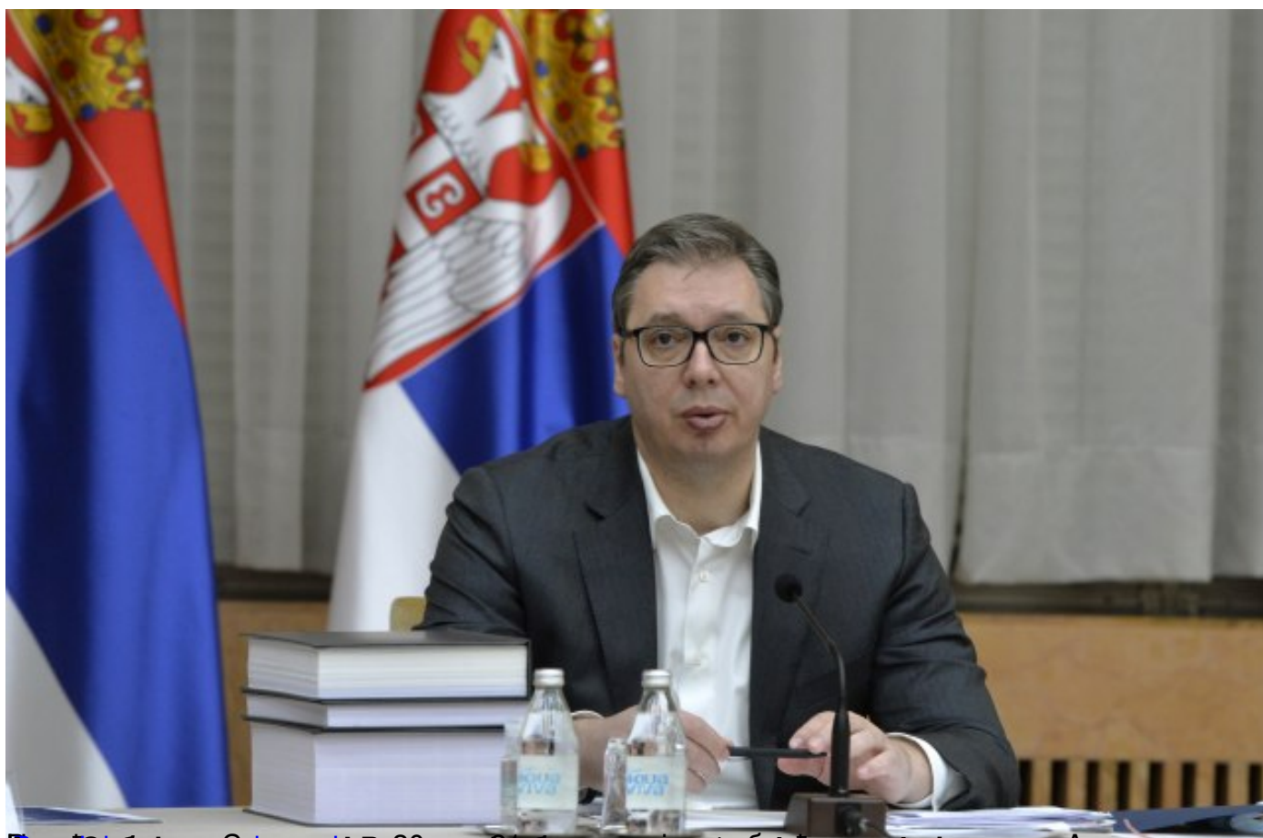
Президент Србије Александар Вучић на седници Савета за националну безбедност у Београду, 7. марта 2021. године.