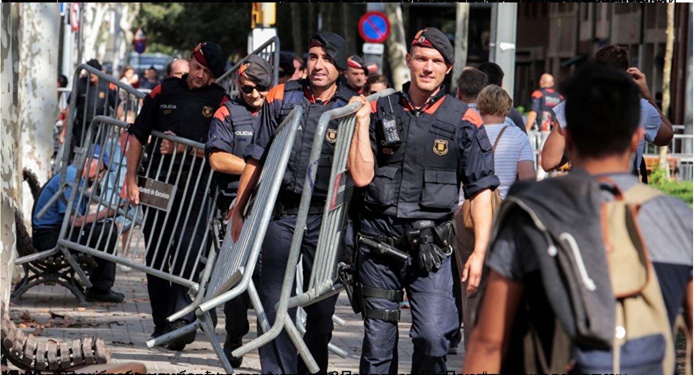
14.10.2017. Карлес Пуџдемон, лидер независности Каталоније, у Барселони. На слици испод је уредник уредника