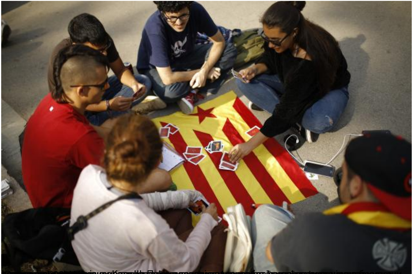
Карлес Пуџдемон: Поштоваћемо вољу народа Каталоније, али тражићемо решење кроз преговоре с