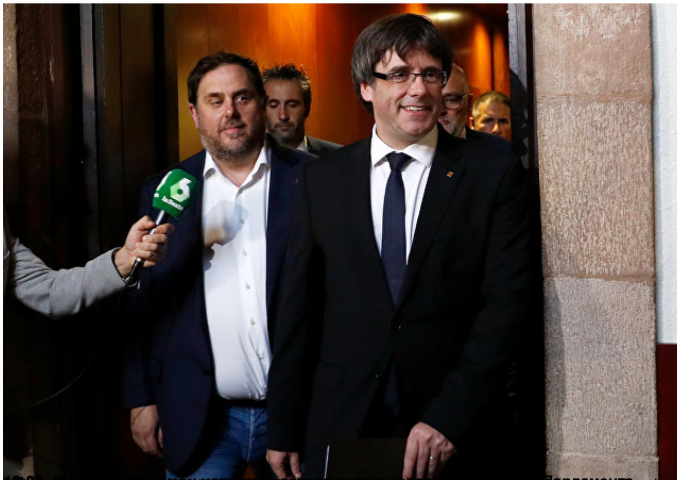
Карлес Пуџдемон и други политичари испред парламента Каталоније