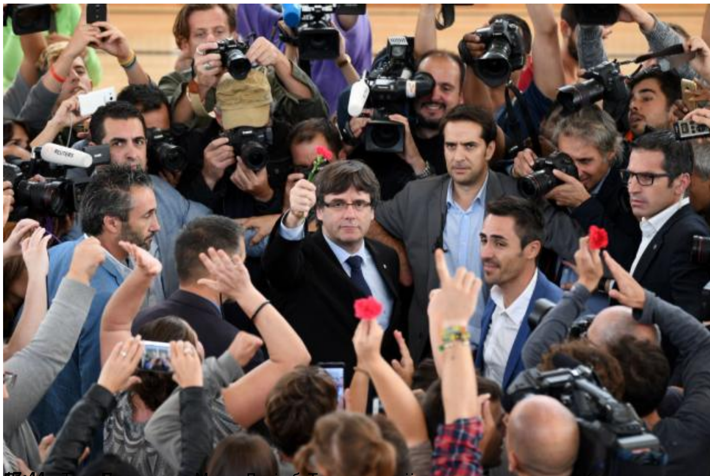
Председник Каталонске самоуправне регије, политички вођа и каталонског лидера Карлеса