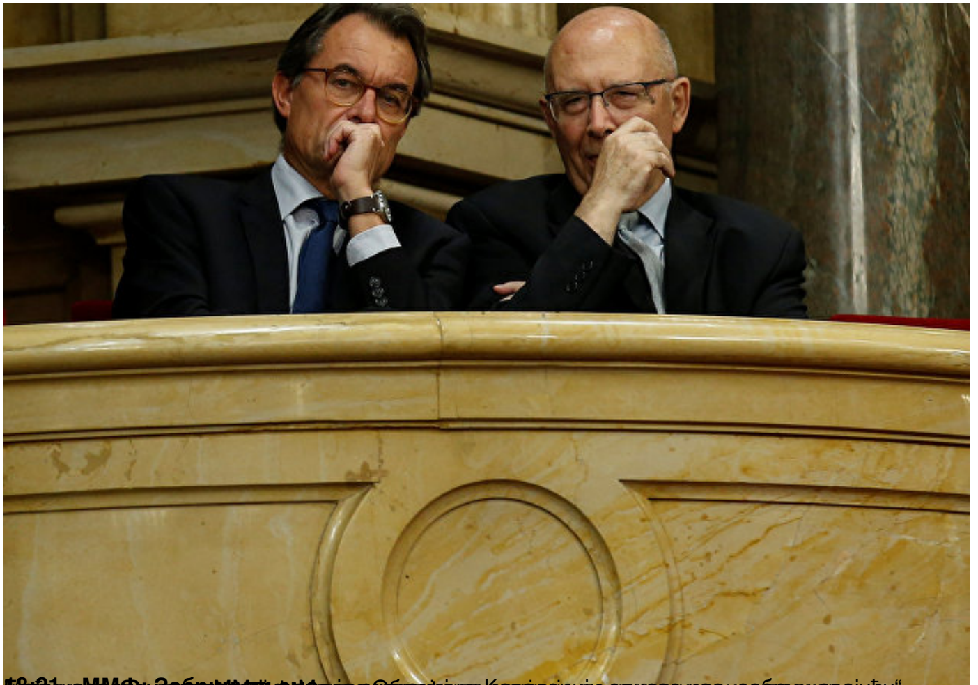
10.10.2017. ММФ: Работници у Каталонији се плаше да се криза не извабери извајућу".