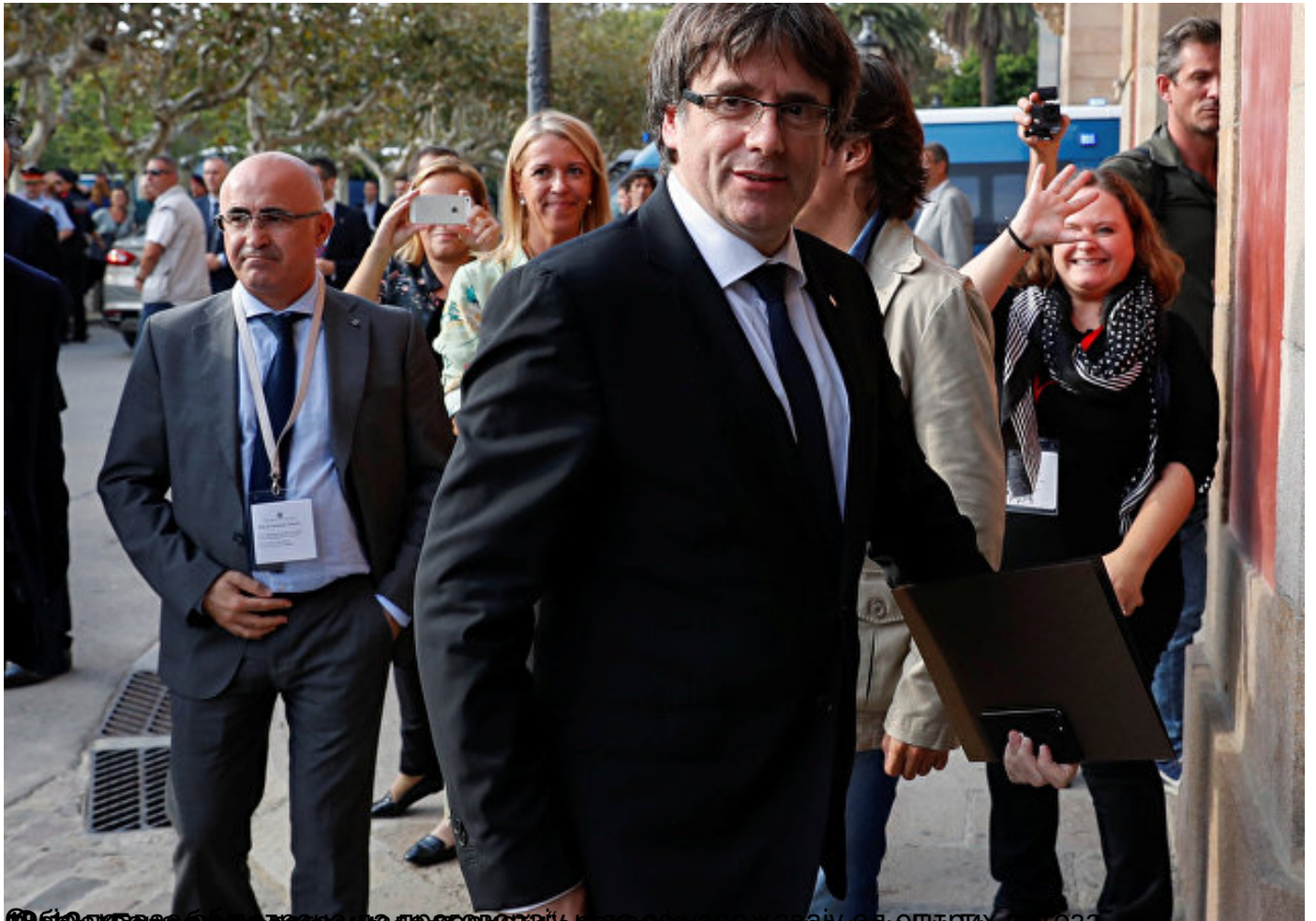
Поштоваћемо вољу народа Каталоније, али тражићемо решење кроз преговоре с