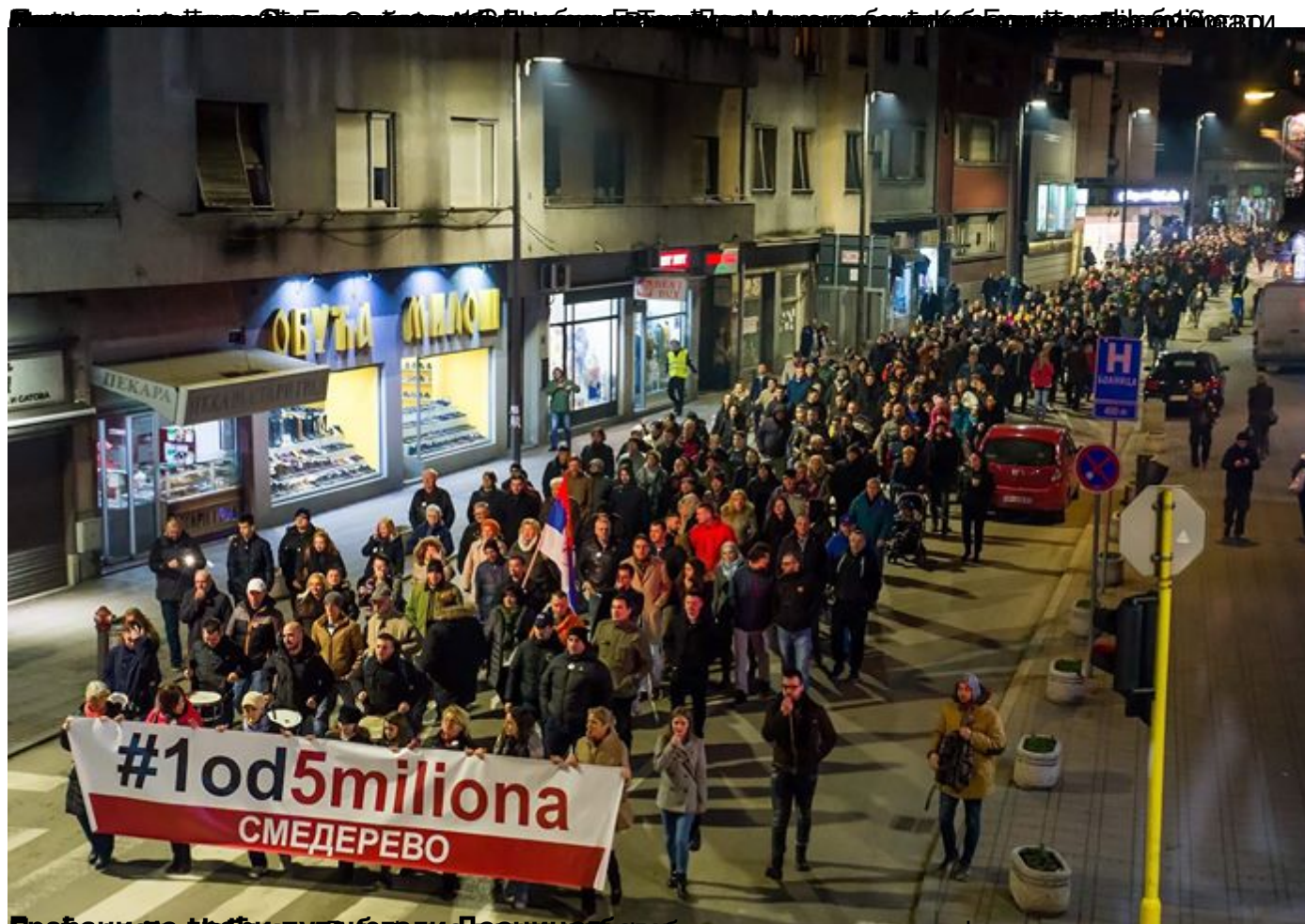
Брзи покрет "1 од 5 милиона" у Смедереву, где су грађани изразили своје незадовољство