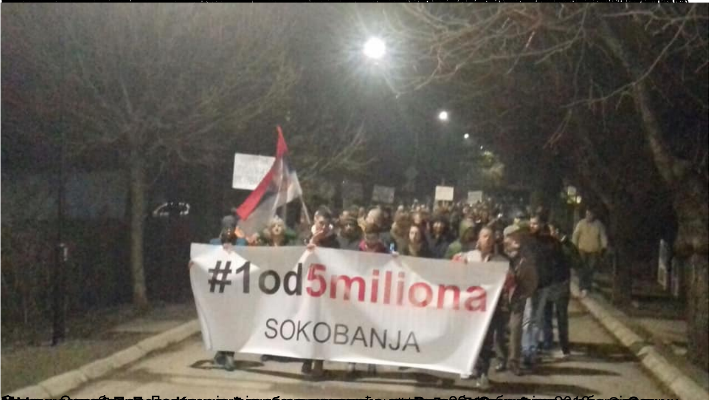
Њежић, Милош / Српска Република