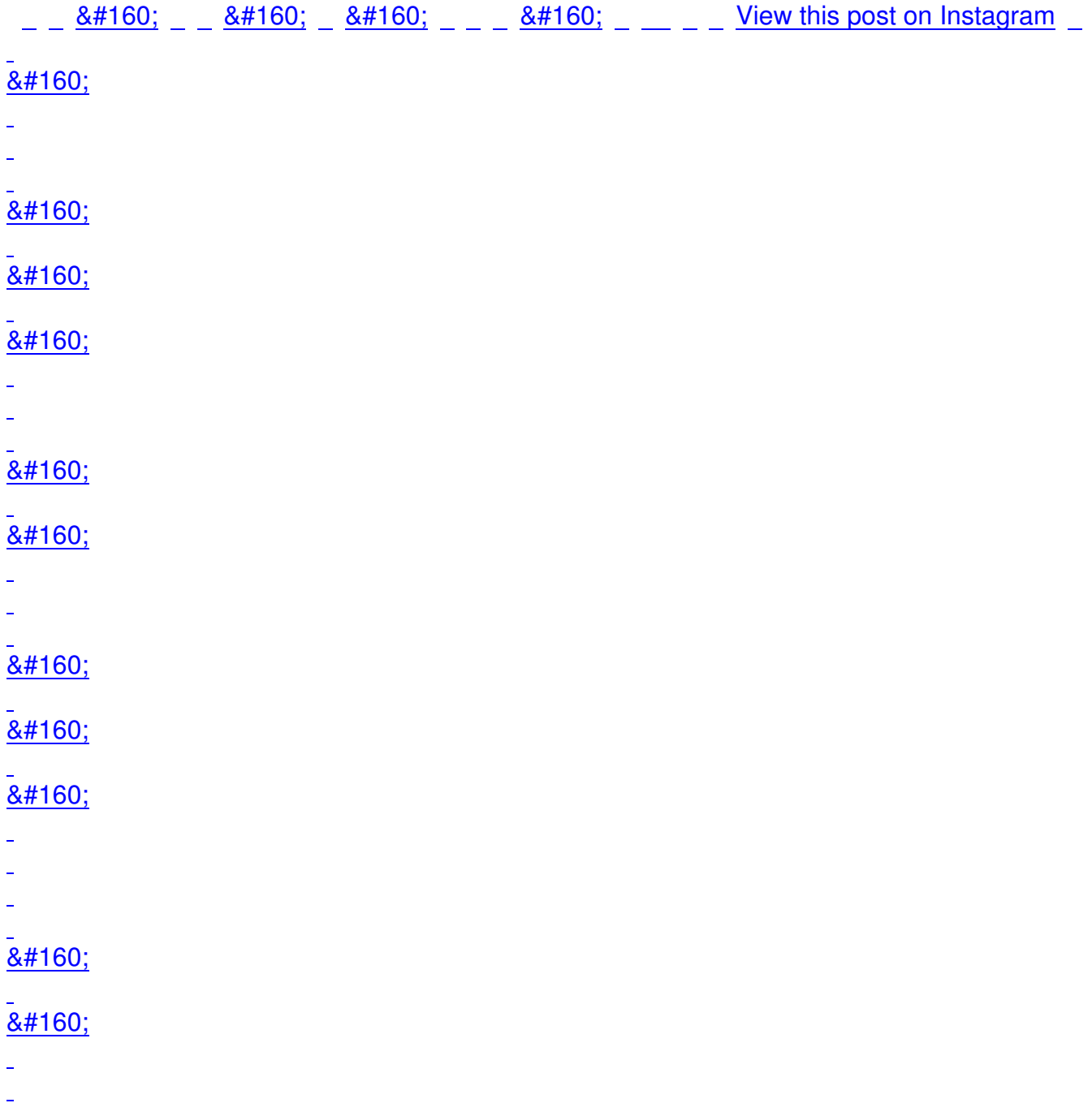
A post shared by Aleksandar Vučić (@buducnostsrbijeav)

Вучић је рекао да је Србија добила много подршке на прва два састанка које је јутрос имао у Пекингу, са премијером НР Кине Ли Ђијангом и председавајућим Националног комитета Кинеске народне политичке консултативне конференције Ванг Хунингом.