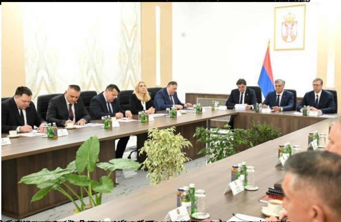
Изјави Александар Вучић о изјави Лаврова: Разумели смо поруку. Србија се налази на европском путу и на